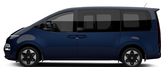
Moonlight Blue Pearl