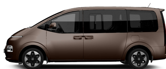
Gaia Brown Pearl nur für Bus verfügbar