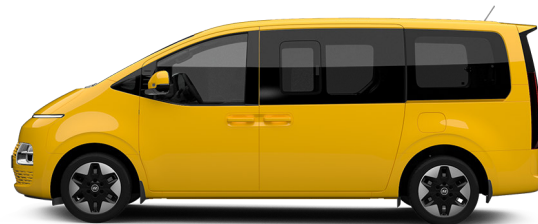
Dynamic Yellow nur für Transporter verfügbar