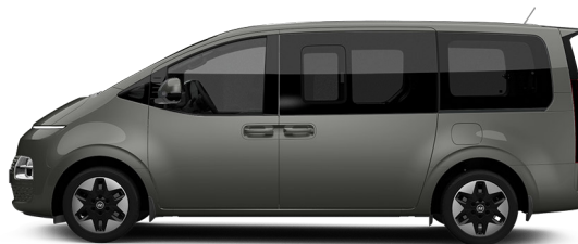
Olivine Gray Metallic nur für Bus verfügbar