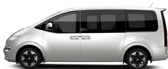
Shimmering Silver Metallic