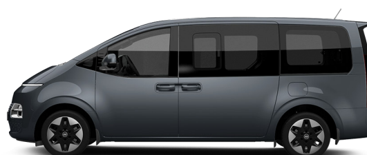
Graphite Gray Metallic